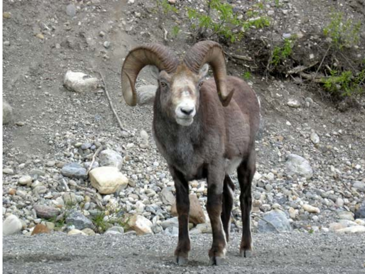
כבש גדול קרניים (Big Horn Sheep)